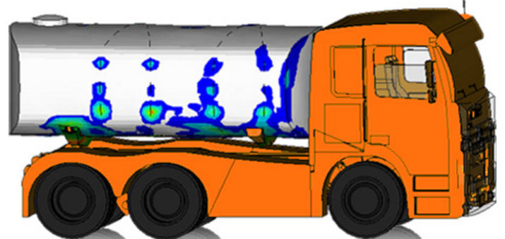
Vergleichsspannung Tank (t=1.0 sec)